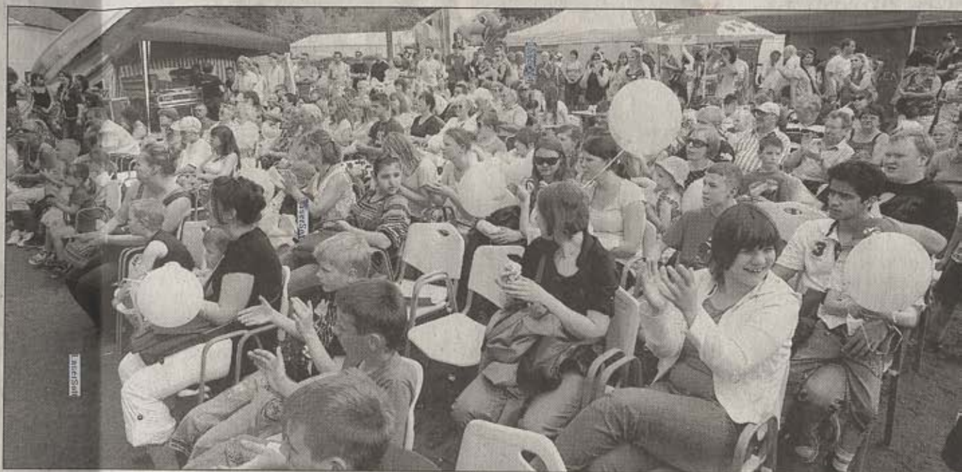
Applaus für die Künstler: Zwei Tage lang konnten die Besucher der Erlebnismesse im Familiengarten Eberswalde ein abwechslungsreiches Kulturprogramm auf der Bühne am Alten Walzwerk erleben.