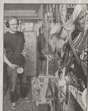
Aufklärung: Der mobile Aids-Truck zog viele Besucher an.