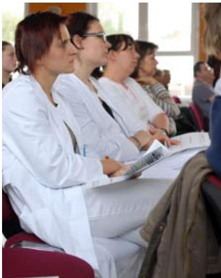
Die Zuhörerinnen konnten vom „Hygieneseminar“ viele praktisch nützliche und wichtige Erkenntnisse mit in den Stationsalltag nehmen.

Von MRSA hat man des öfteren schon gehört – das Kürzel steht für „multiresis-