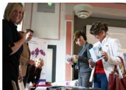
Ein Blick in die Fachausstellung

„Comprehensive Cancer Centers“ – zu gewährleisten wäre, die überwiegend an Universitäts- oder Großkliniken angesiedelt sind. Wenn die regional bestehenden Krankenhäuser die selben Ergebnisse erreichen wie große Zentren, entspricht dieses Angebot viel mehr den Voraussetzungen in einem Flächenland wie Brandenburg. Wir freuen uns sehr, dass wir mit diesen Daten hervorragende Behandlungsergebnisse für Tumorpatienten in unserer Region belegen können. Wir sind damit nachweislich in der Lage, eine hochqualifizierte wohnortnahe Versorgung der Patienten zu gewährleisten, die einer Behandlung in weit entfernten Medizinzentren in nichts nachsteht.“