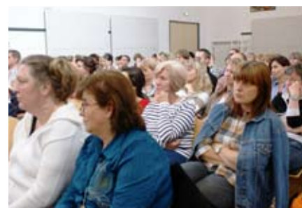
Der Saal war bis zum letzten Platz besetzt.

schen Krebsregistern zu verwechseln, die es auch in anderen Bundesländern gibt und die in erster Linie der Ermittlung allgemeiner statistischer Aussagen zur Häufigkeit von Krebs und zur Sterblichkeit dienen. Im Unterschied dazu ermöglicht das Klinische Krebsregister auch Rückschlüsse auf die Art der Behandlung und deren Erfolg, bis hin zu aufgetretenen Nebenwirkungen. So erhalten Ärzte wichtige Hinweise zu den Ergebnissen ihrer Therapie. Auch For-