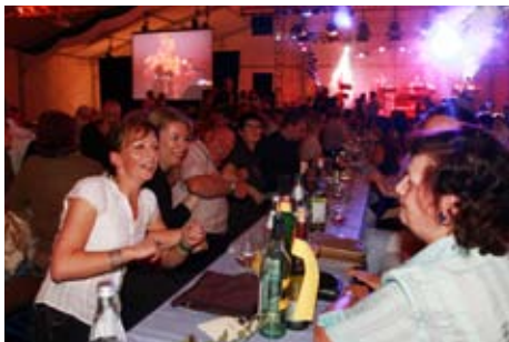
Im großen Festzelt wurde getanzt und fröhlich geschunkelt.