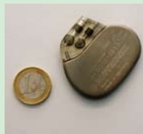
Größenvergleich: Moderner Herzschrittmacher und Ein-Euro-Münze.

Mit speziellen Informationsangeboten in Eberswalde, Angermünde und Prenzlau wollen die Mediziner außerdem die breite Öffentlichkeit erreichen. So beteiligten sie sich u.a. mit öffentlichen Vorträgen an dem von der Deutschen Herzstiftung ausgerufenen „Herzmonat“ November. Unter dem Motto „Gesundheit ist Herzenssache“ wird am 16. und 17. Mai 2009 die Kardiologie einen besonderen Schwerpunkt auf der Erlebnismesse „Mensch & Gesundheit“ bilden.